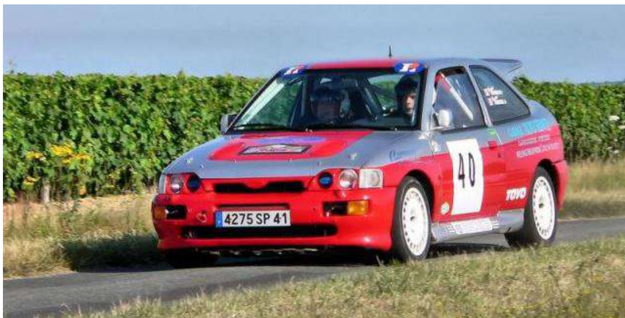
Photo Rallye Centre Ouest